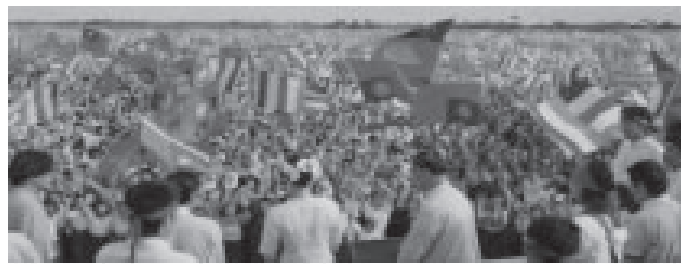
ภาพที่ 8 นางออง ซาน ซูจี ปราศรัยครั้งแรกท่ามกลางประชาชนผู้สนับสนุน 26

คำพูดนี้แสดงให้เห็นถึงความหวังและความศรัทธาที่นักวิชาการเหล่านี้มีต่อนางออง ซาน ซูจี ตลอดจนการให้ความสำคัญของผู้นำเชิงจิตวิญญาณในการนำพาทิศทางการไปสู่ความสำเร็จตามเป้าหมายครั้งแรกที่ได้รับการทาบทามเธอตอบปฏิเสธ แต่ในที่สุดด้วยคุณลักษณะของ “การทำในสิ่งที่ต้องทำ” ของผู้นำเชิงจิตวิญญาณ ทำให้นางออง ซาน ซูจี จากผู้หญิงธรรมดาที่มีชีวิตสุขสงบและไม่เคยมีความคิดว่าจะต้องมาเป็นผู้นำทางการเมืองจำต้องตอบรับ และต้องขึ้นเวทีปราศรัยครั้งแรกต่อหน้าประชาชนชาวเมียนมานับล้านที่ทราบข่าวการมาของเธอด้วยการกระจายข่าวแบบบอกปากต่อปาก อันเป็นการแสดงให้เห็นถึงความศรัทธาที่มีต่อเธออย่างเด่นชัด ดังแสดงในภาพที่ 8