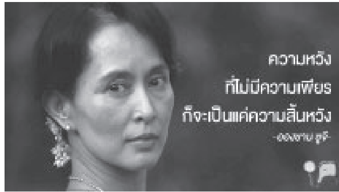
ภาพที่ 1 ภาพนางอองซาน ซูจี