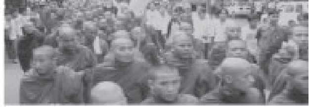
ภาพที่ 9 การมาให้กำลังใจนางออง ซาน ซูจีของพระภิกษุสงฆ์ชาวเมียนมา 33