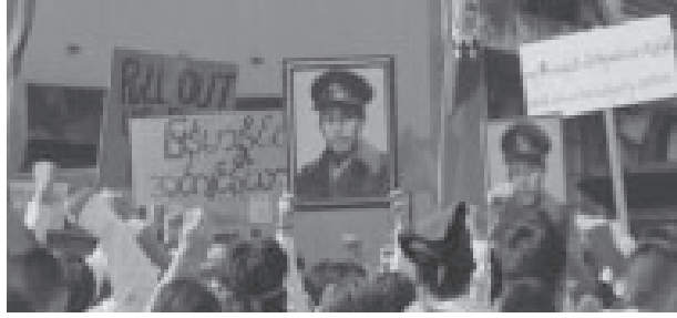
ภาพที่ 5 ผู้เรียกร้องประชาธิปไตยถือภาพนายพลอู ออง ซาน 18