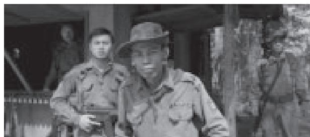
ภาพที่ 3 ทหารพม่ากับครั้งแรกที่ได้ยินเสียงเปียโน 12

ภาพยนตร์เรื่องนี้มีฉากที่แสดงให้เห็นถึงความเมตตาและการให้อภัยของนางออง ซาน ซูจี ที่มีต่อทหารชั้นผู้น้อยที่มาเฝ้าเธอในช่วงที่ถูกกักบริเวณในบ้านของตัวเองด้วยท่าทีที่ไม่เป็นมิตรและข่มขู่คุกคาม โดยที่ในจำนวนทหารที่ผลัดเปลี่ยนกันมาเฝ้านั้นมีอยู่หนึ่งคนที่ภาพยนตร์สื่อให้เห็นถึงความเมตตาของเธอ ทหารผู้นี้ในฉากแรกๆมีท่าทีที่ไม่เป็นมิตรและไม่รู้จักแม้กระทั่งคำว่า “ดนตรี” เมื่อได้ยินเสียงเปียโนจากการเล่นของนางออง ซาน ซูจี เป็นครั้งแรกในชีวิต และเป็นผู้ที่ไม่ยอมให้เธอพบผู้สนับสนุนที่หน้าบ้านในวันประกาศผลการเลือกตั้งทั่วประเทศที่พรรค NLD ได้รับชัยชนะอย่างท่วมท้น แต่นางออง ซาน ซูจีไม่ถือโกรธแต่กลับให้อภัยและแสดงความเมตตาด้วยการสอนให้ทหารผู้นี้เข้าใจคำขวัญและคำพูดให้กำลังใจต่าง ๆ ที่เธอเขียนไว้เตือนใจในบ้านพัก ความหมายที่สื่อคือการให้อภัยทหารชั้นผู้น้อยที่ปฏิบัติตามคำสั่งผู้บังคับบัญชาตนเอง