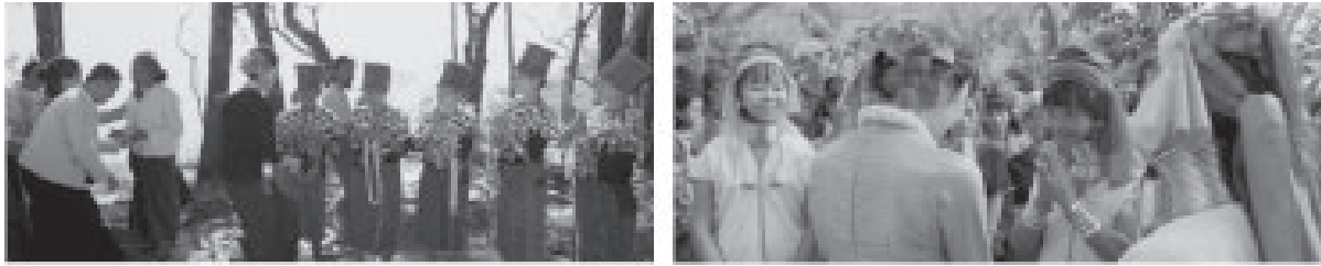
ภาพที่ 6 นางออง ซาน ซูจี กับการเดินทางไปพบชนกลุ่มน้อยต่างๆ 21