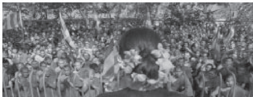
ภาพที่ 10 ฉากจบของภาพยนตร์

ภาพยนตร์เรื่อง The Lady แสดงให้เห็นถึงคุณลักษณะความเป็นผู้นำเชิงจิตวิญญาณของนางออง ซาน ซูจี ได้แก่ 1) วิสัยทัศน์ 2) การมุ่งประโยชน์เพื่อผู้อื่น อันประกอบด้วย (1) การให้อภัย (2) ความเมตตา (3) การยึดหลักความถูกต้องดีงาม (4) ความเห็นอกเห็นใจ/ความกรุณา (5) ความซื่อสัตย์สุจริต (6) ความอดทนอดกลั้น (7) ความกล้าหาญ (8) ความน่าเชื่อถือน่าวางใจ และ (9) ความนอบน้อม และ 3) การสร้างความหวังความศรัทธาให้กับผู้ตามอย่างครบถ้วน และยังแสดงให้เห็นถึงความสำคัญของผู้นำเชิงจิตวิญญาณในการนำพองค์การไปสู่ความสำเร็จตามเป้าหมาย อาจกล่าวได้ว่าเธอเป็นผู้นำเชิงจิตวิญญาณที่แท้จริงในโลกยุคปัจจุบันคนหนึ่ง ถึงแม้ว่าภาพยนตร์เรื่องนี้จะออกฉายตั้งแต่ปี พ.ศ.2554 แต่เรื่องราวที่น่าเสนอยังถือได้ว่ามีคุณค่าในการศึกษา การจะได้มาซึ่งประชาธิปไตยไม่ใช่เรื่องง่ายในทางปฏิบัติ ภาวะผู้นำหรือบทบาทของนางออง ซาน ซูจี อาจมีข้อสงสัยหรือเคลือบแคลงบ้างในสถานการณ์ปัจจุบัน แต่ความเสียสละตัวเองเพื่อประเทศชาติ และการเลือกประเทศชาติมากกว่าครอบครัวของเธอก็ปฏิเสธไม่ได้ว่าเป็นส่วนสำคัญในการนำมาซึ่งสันติภาพและประชาธิปไตยสู่สาธารณรัฐแห่งสหภาพเมียนมา